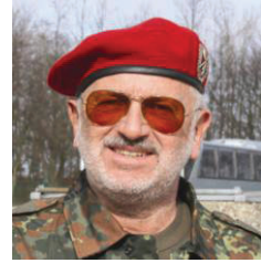
Wolfgang Strobel

Die Veranstaltung wurde als Kameradschaftstreffen während einer Fahrt auf dem Fahrgastschiff „Regensburg“ der Reederei Klinger durchgeführt – übrigens wurde auf diesem Schiff, früher „Princesse Marie-Astrid“, 1985 das Schengener Abkommen I auf der Mosel unterzeichnet.